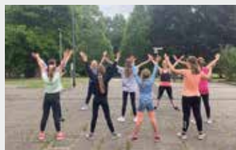
Freizeit- und Breitensport