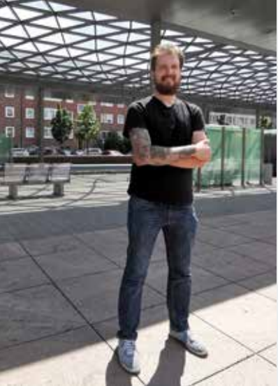
Streetworker am Buschmannshof