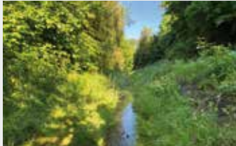
Renaturierung Dorneburger Mühlenbach