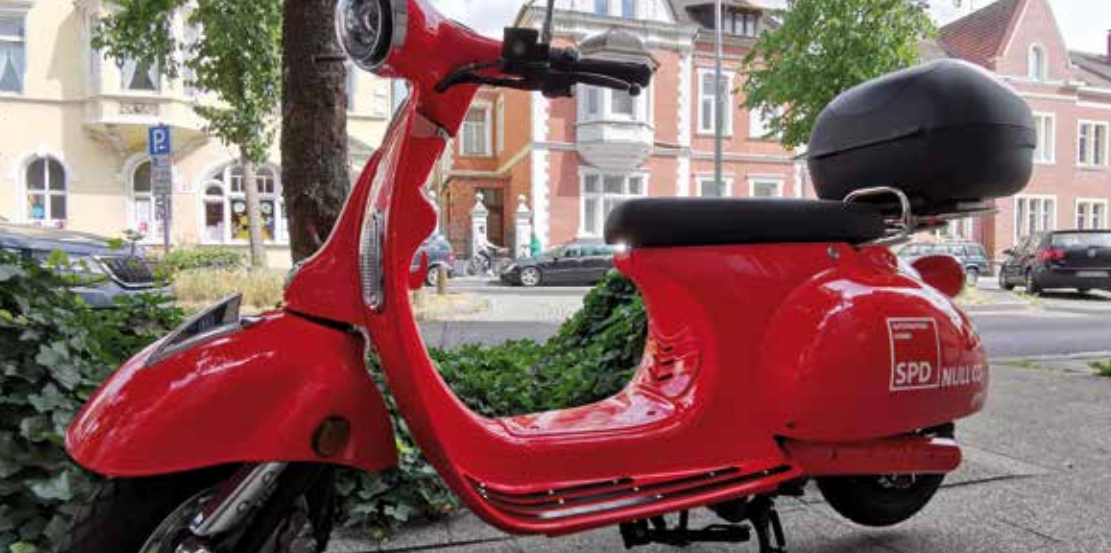
Elektroroller der SPD-Ratsfraktion – Null CO 2