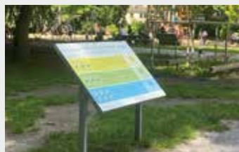
Bewegungsparcours Eickeler Park