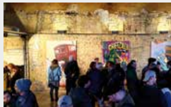
Alter Wartesaal im Herner Bahnhof