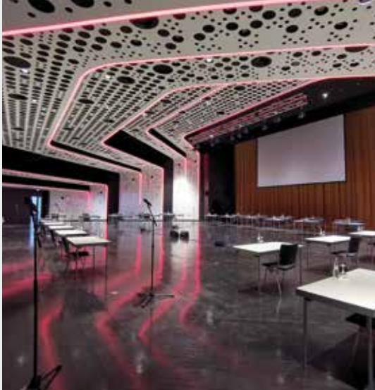
Sitzung im Kulturzentrum