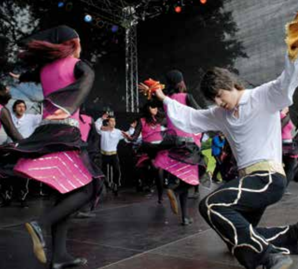
Kulturfestival Schloss Strünkede