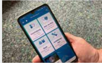
Service per App