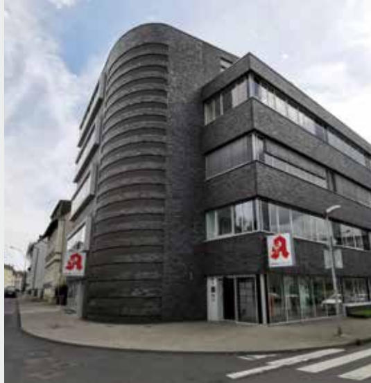
Ärztehaus und Apotheke