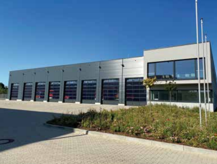
Feuerwache Koniner Straße