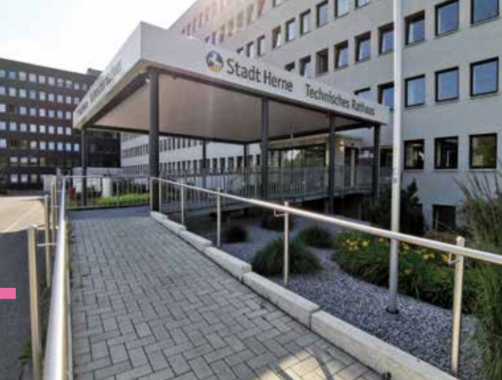
Barrierefreiheit Technisches Rathaus