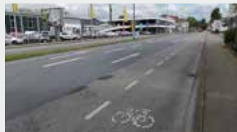
Modernisierung Radverkehr Bochumer Straße