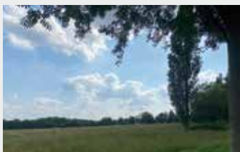
Neugestaltung Lohofer Feld