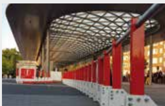
HTS – Herner Truck Sperre