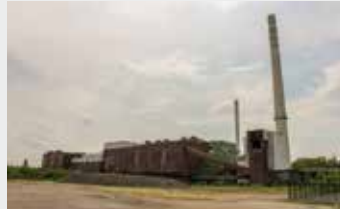
Umgestaltung General Blumenthal