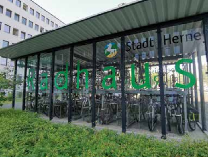
Radhaus am Technischen Rathaus