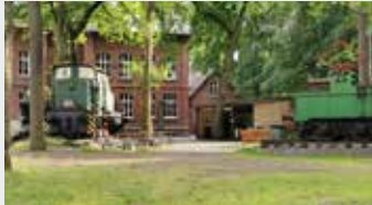
Neubau Verkehrsschule hinter dem Heimatmuseum